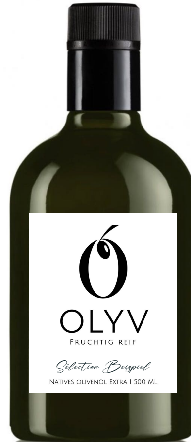
ICE DOP 500 ML (erst ab 01.12.2024 verfügbar)