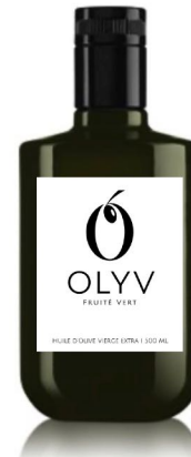
SELEKTION FRUCHTIG GRÜN 500 ML CHF 24.90

VERSANDKOSTEN FÜR 1 FLASCHE VERSANDKOSTEN FÜR 2-5 FLASCHEN VERSANDKOSTEN AB 6 FLASCHEN