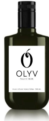
SELEKTION FRUCHTIG REIF 500 ML CHF 24.90