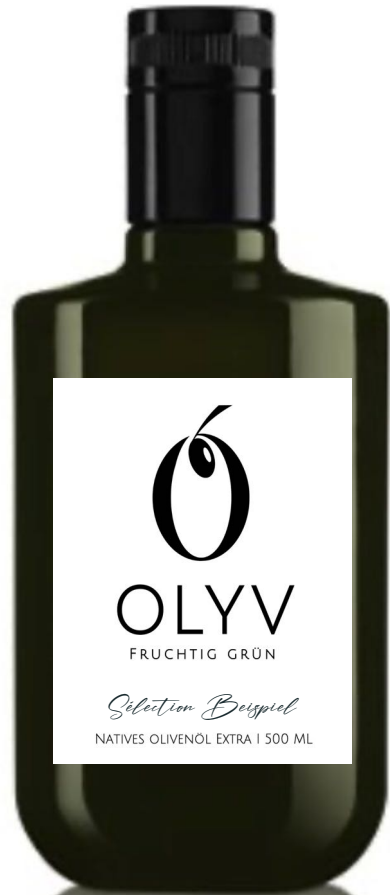
CENTURY DOP 500 ML