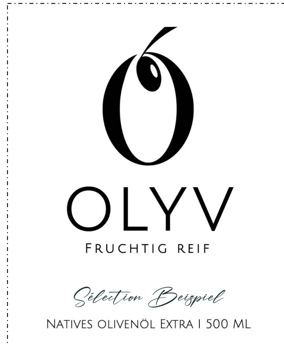
NAME IHRER WAHL AUF ETIKETT